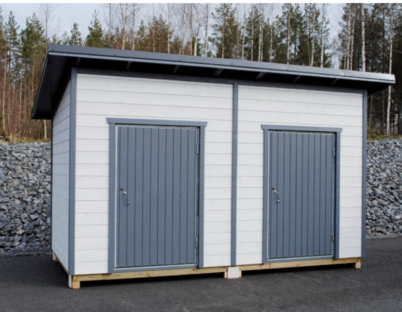
Räätälöity pihavarasto 10.6 – suunnittele tarpeidesi mukaisesti