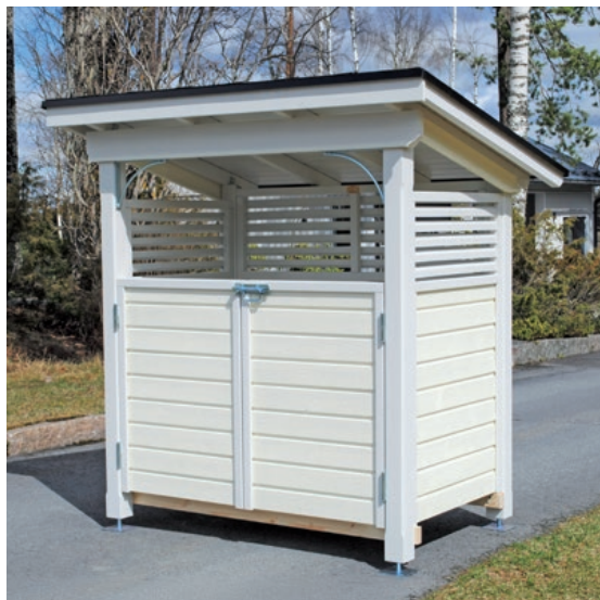
Koti-Rikka 3 – 2 x 240 L