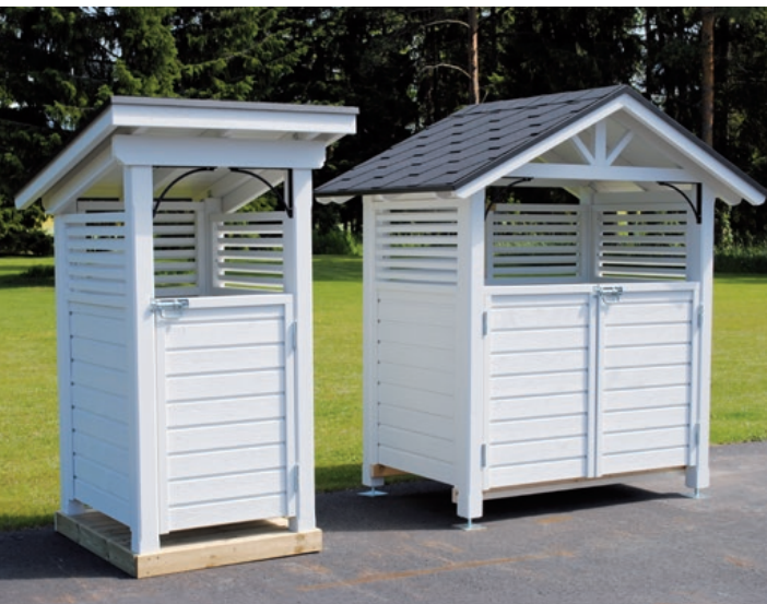
Koti-Rikka 1 – 1 x 240L ja Koti-Rikka 3 – 2 x 240

Koti Rikka Räätelöity – Tarpeiden mukaan yhdistetyt katokset