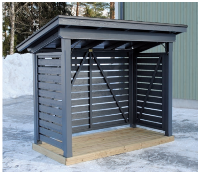
Polttopuukatos - n. 2,4 m 3 polttopuita