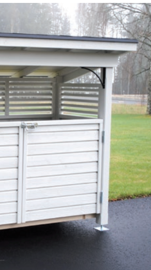
Malli 4 660 L ja 240 L

Koti-Rikka on helpottanut jätehuoltoa jo 20 vuotta.