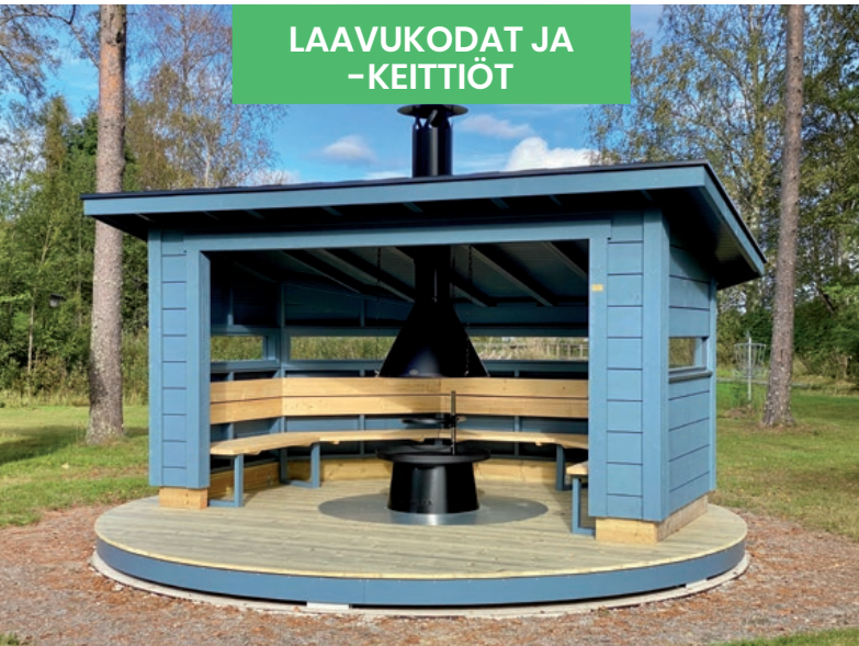
LAAVUKODAT JA -KEITTIÖT