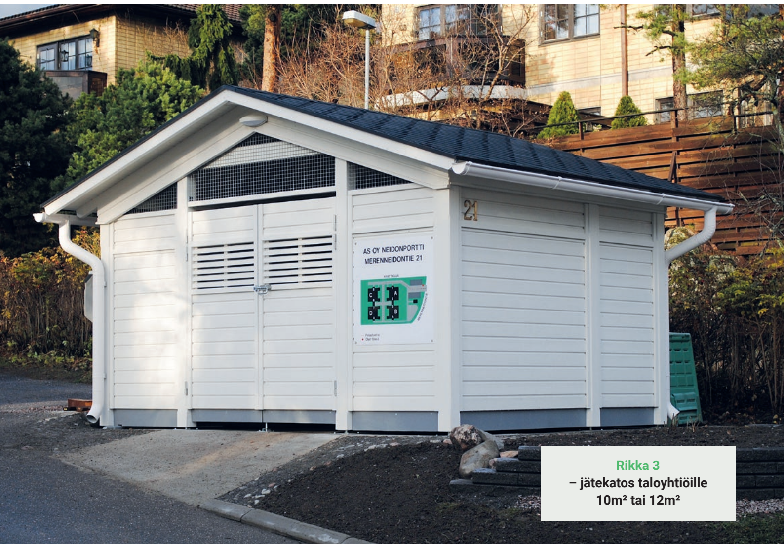
Rikka 3 – jätekatos taloyhtiöille 10m 2 tai 12m 2

Rikka-Katoksia on valmistettu jo 25 vuotta.