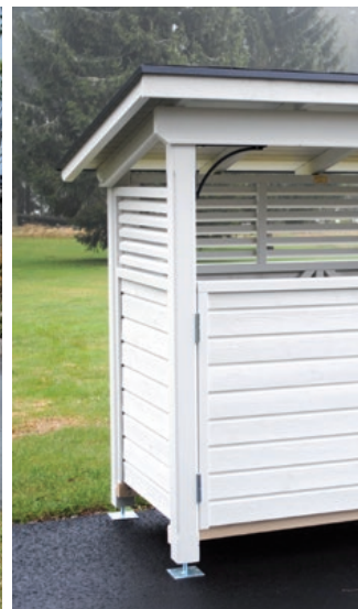
Koti-Rikka 3 – 3 x 240 L tai