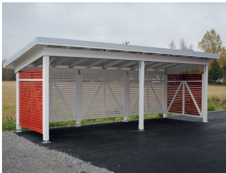
Pyöräkatos – 12 pyörälle