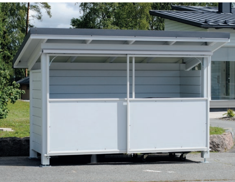
Rivi-Rikka – jatkettava jätekatos astioiden tilantarpeen mukaan. Kuumasinkityt teräsrunkoiset liuku- ovet eivät vie syvyyssuunnassa tilaa kuten saranaovet.