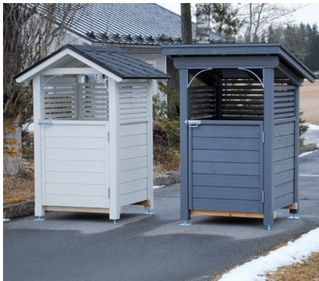
Koti-Rikka monilokeroastialle - 1 x 360-370 L