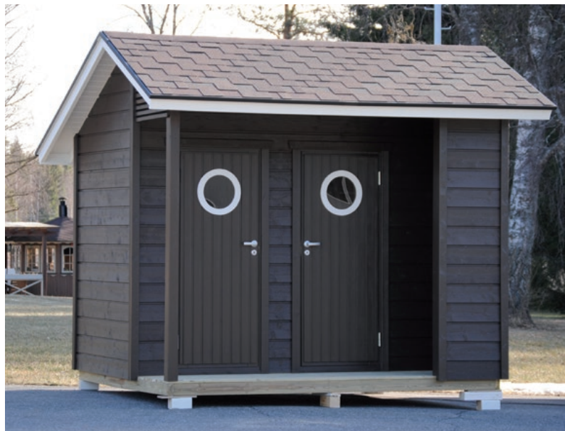
Pihavarasto & käymälä 7.2 – yhdistetty varasto ja käymälä 7,2 m 2